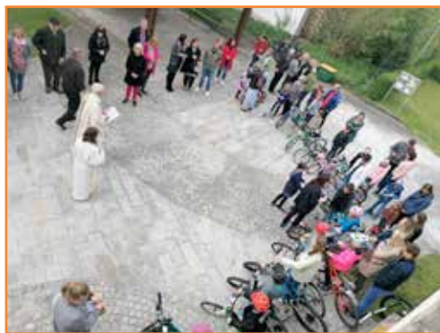
Familiengottesdienst am 30. April 2023 mit Fahrradsegnung