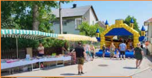
Kirtag und Patroziniumsfest