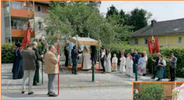
Danke allen, die zum Gelingen dieses Festes beigetragen haben.