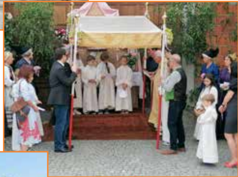
Altäre wurden von drei Familien aufgebaut.